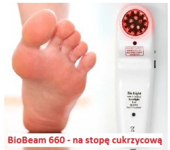
BioBeam 660 - na stopę cukrzycową